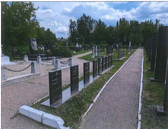
Рис. 6. Могильные тумбы