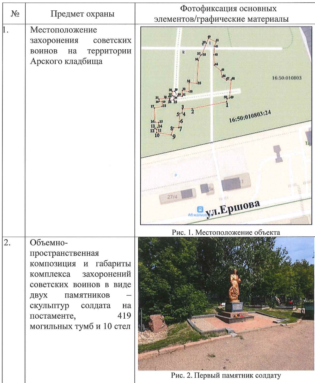
Таблица предмета охраны объекта культурного наследия регионального значения «Захоронения советских воинов, умерших от ран и болезней в эвакогоспиталях г.Казани», 1941 – 1945 гг., расположенного по адресу: Республика Татарстан, г. Казань, Арское кладбище