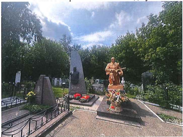
Рис. 10. Второй памятник солдату