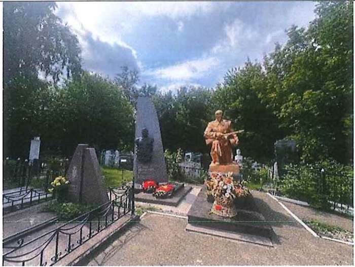
Рис. 3. Второй памятник солдату