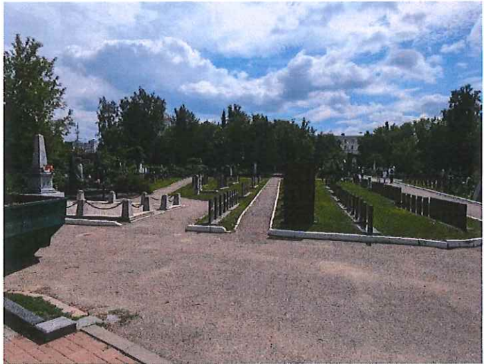
Рис. 4. Комплекс захоронений могильных тумб