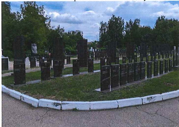
Рис. 11. Стелы