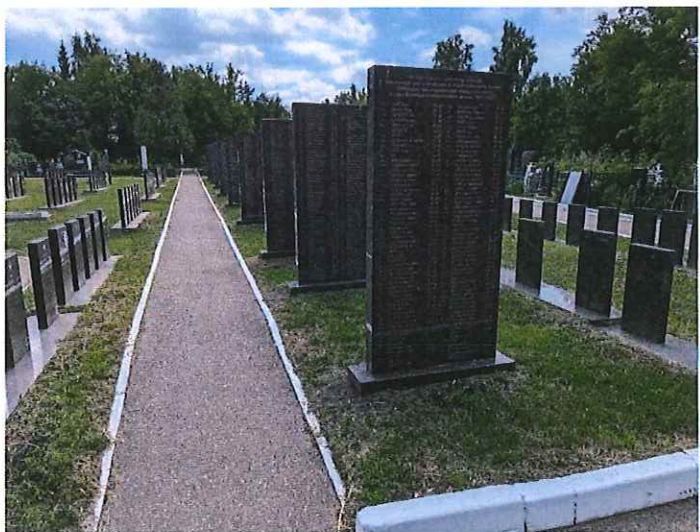
Рис. 5. Стелы