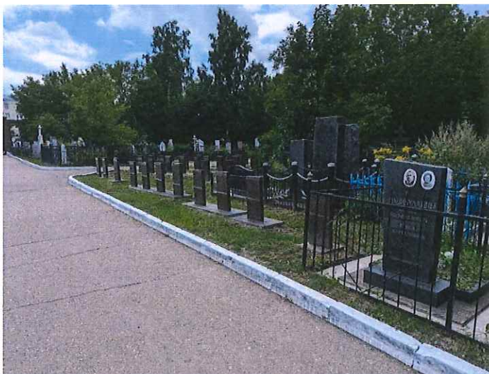
Рис. 7. Могильные тумбы