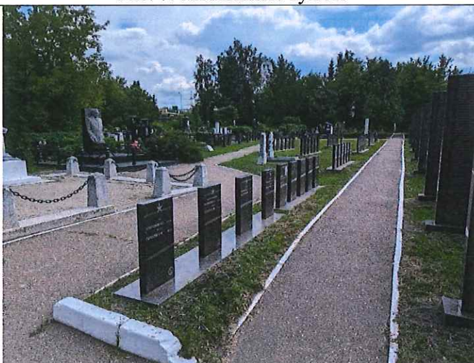
Рис. 8. Могильные тумбы