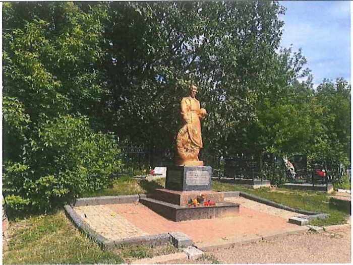
Рис. 9. Первый памятник солдату

На лицевой грани выбита надпись: «Вечная память славным советским воинам, павшим в дни Великой Отечественной войны 1941-1945 гг. в борьбе за свободу и независимость нашей Родины»