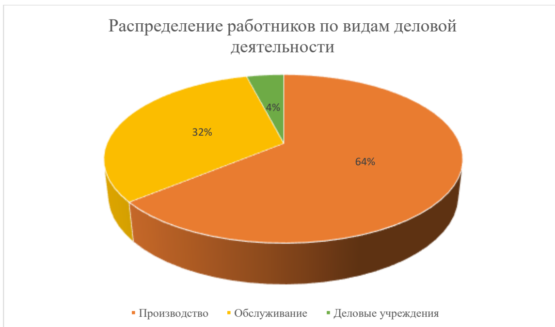
Рисунок 2 - Распределение численности работников по видам экономической деятельности

Таким образом, в Староюрашском сельском поселении доля занятых в производственной сфере составляет 64% от общей численности работающих, в сфере обслуживания – 32% и в деловых учреждениях – 4%.