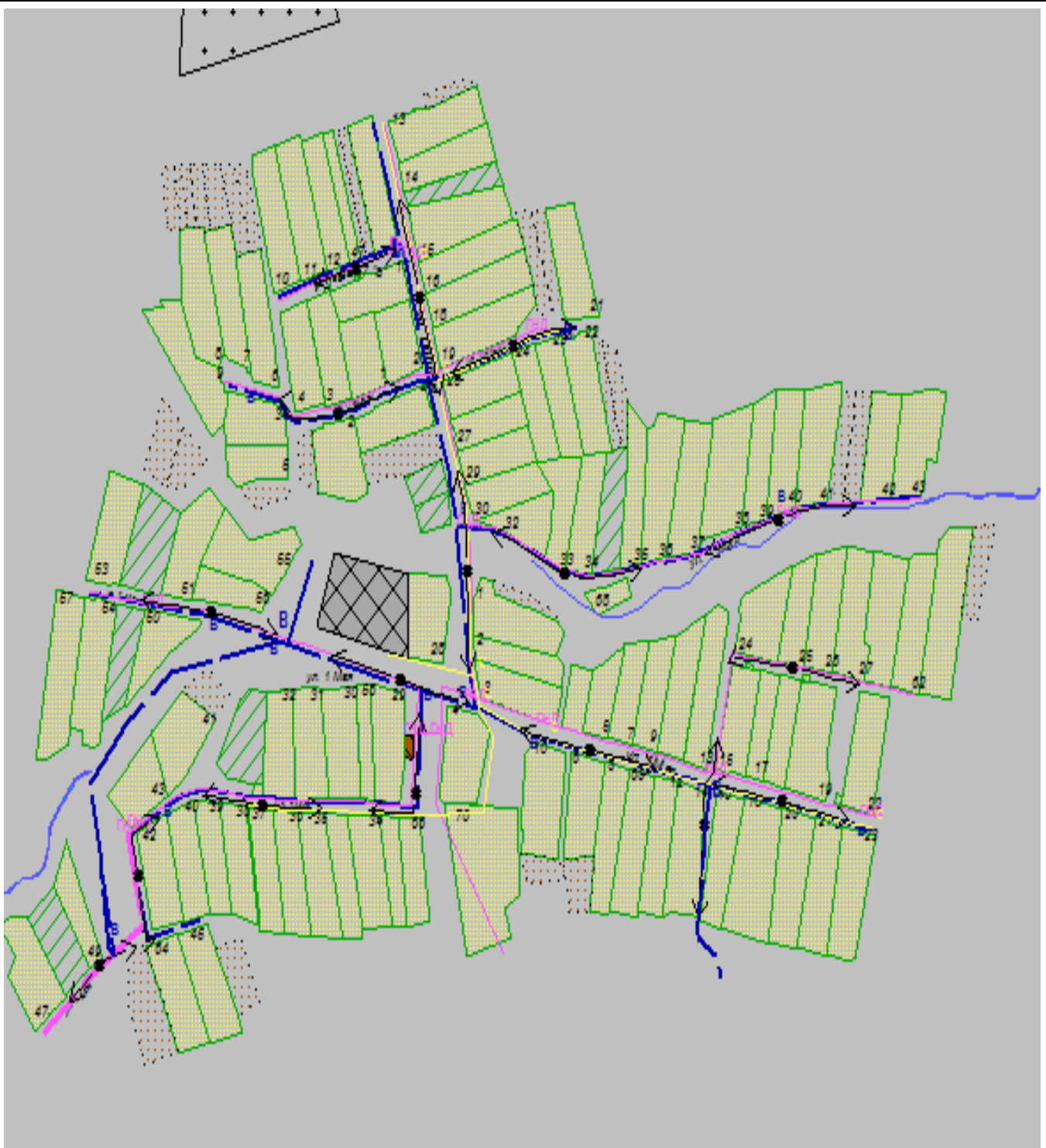
Схема водоснабжения н.п. Еникей-Чишма Катмышского сельского поселения Мамадышского муниципального района РТ