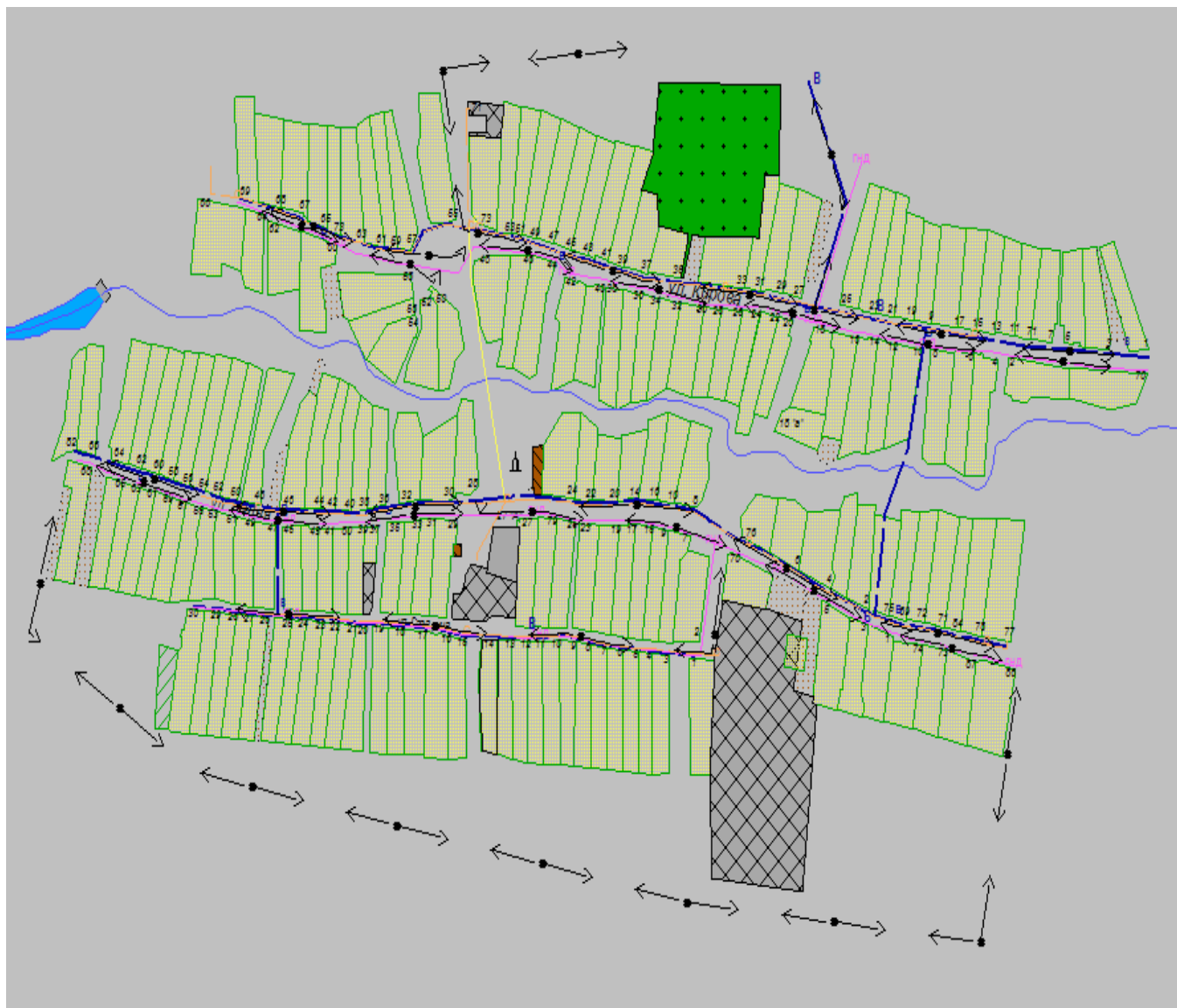
Схема водоснабжения н.п. Баскан Катмышского сельского поселения Мамадышского муниципального района РТ