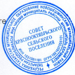
В. В. Захаров

Башлығы Кызыл Октябрь авыл җирлеге Яңа чишмә муниципаль району Татарстан Республикасы