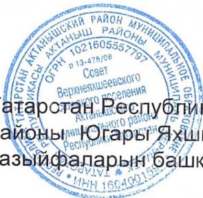
Салахов М. М.

Татарстан Республикасы Актаныш муниципаль районы Югары Яхшый авыл җирлеге рәисе вазифаларын башкаручы