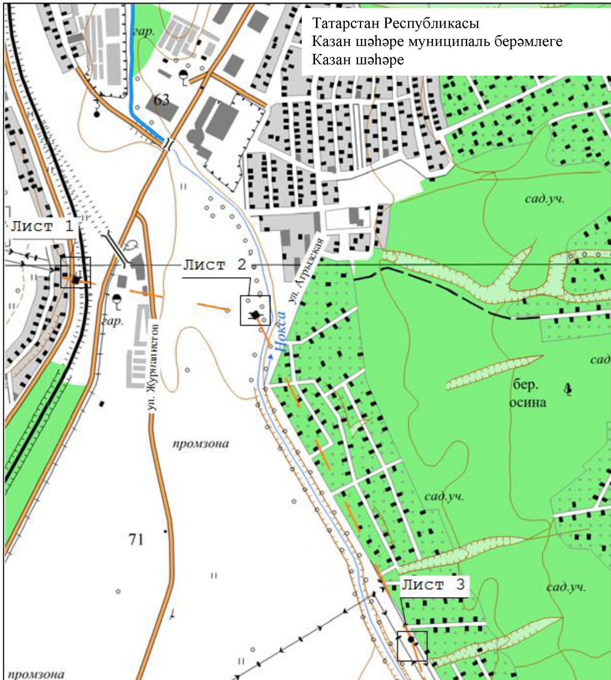
Объект чикләренен күзәтү схемасы

«Киндери – Магистраль 110 кВ электр тапшыру линиясе» төбәк эһәмиятендәге электр челтәре хужалыгы объектын урнаштыру максатларында гавами сервитут чикләре урнашу схемасы