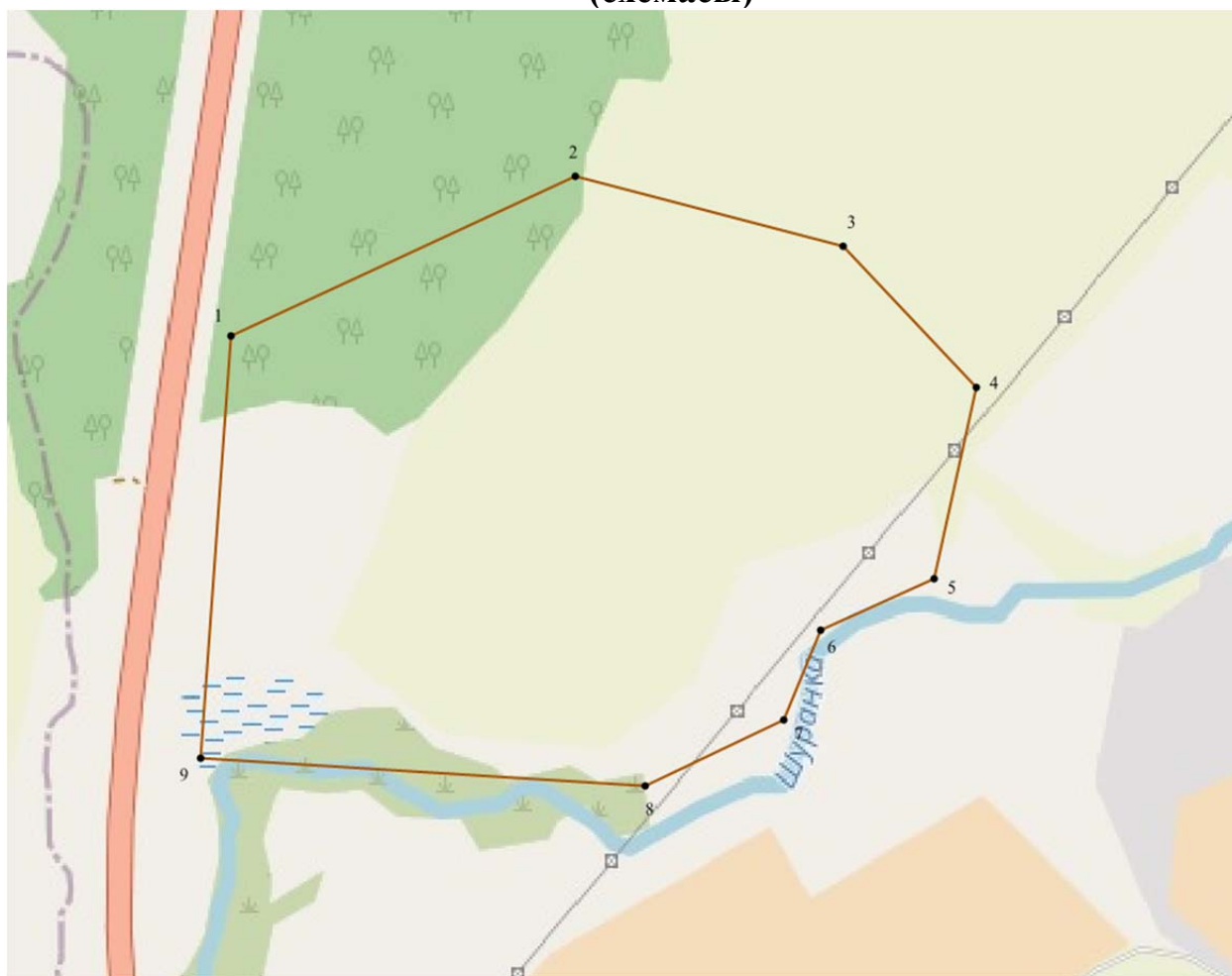
Топографический план объекта культурного наследия