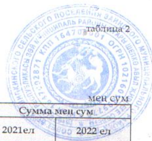
таблица 2 Зэй муниципаль району Югары Шепкэ авыл жирлегенен 2021 һәм 2022 нче елларның план чорына бюджетының фаразланган керем күләме