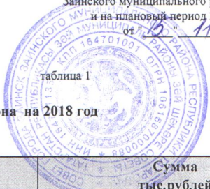
таблица 1 Прогнозируемые объемы доходов бюджета города Заинска Заинского муниципального района на 2018 год