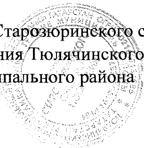
Р. Р. Мараков

Глава Старозюринского сельского поселения Тюлячинского муниципального района