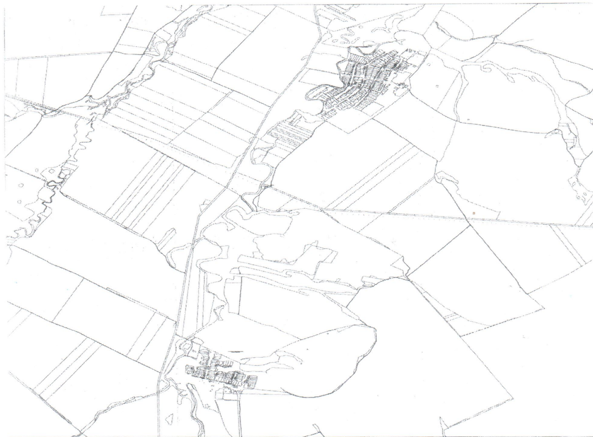
Рисунок 1. Территориальное расположение Степношенталинского сельского поселения и его населенных пунктов

Степношенталинское сельское поселение Алексеевского муниципального района (далее – ССП) состоит из 2 населенных пунктов, их территориальное расположение представлено на рисунке 1.