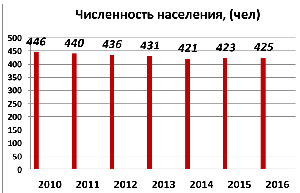
Диаграмма 1. Динамика численности населения

Ниже отображена динамика роста населения с 2010 по 2016 годы.