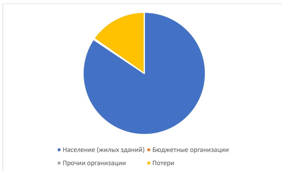
Рисунок 1.3.3 – Структурный баланс полезно отпущенной воды в 2025 году