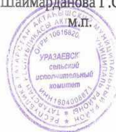
СХЕМА ВОДОСНАБЖЕНИЯ И ВОДООТВЕДЕНИЯ УРАЗАЕВСКОГО СЕЛЬСКОГО ПОСЕЛЕНИЯ АКТАНЬШСКОГО МУНИЦИПАЛЬНОГО РАЙОНА РЕСПУБЛИКИ ТАТАРСТАН НА ПЕРИОД ДО 2036 ГОДА