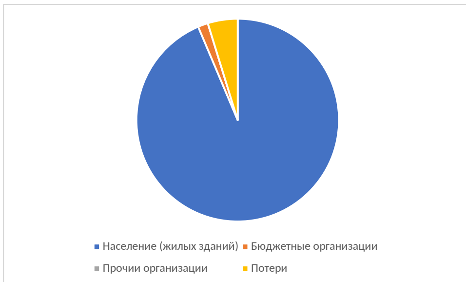
Рисунок 1.3.3 – Структурный баланс полезно отпущенной воды в 2025 году

Наибольший объем потребления питьевой воды на территории Уразаевского сельского поселения Актанышского муниципального района Республики Татарстан приходится на население.