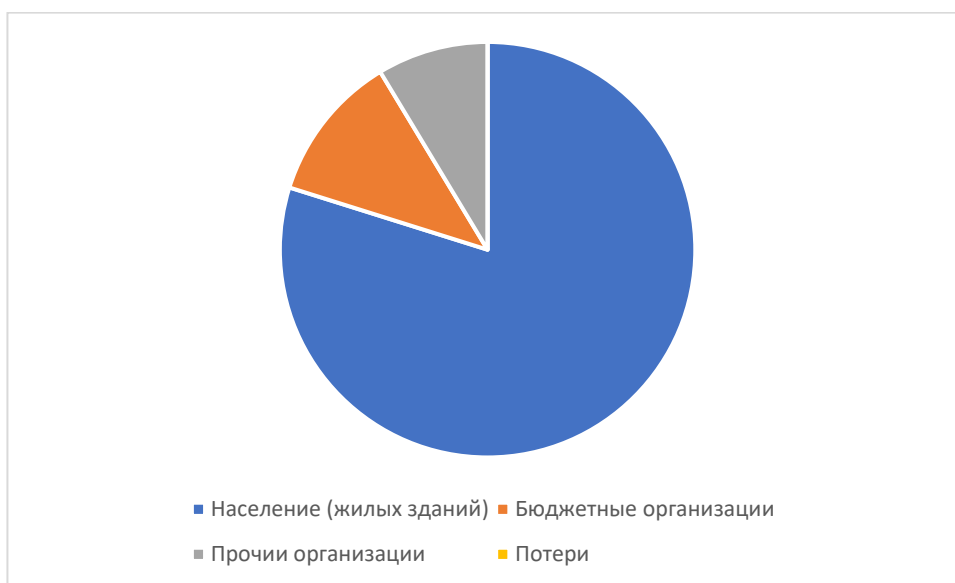
Рисунок 1.3.3 – Структурный баланс полезно отпущенной воды в 2025 году

Наибольший объем потребления питьевой воды на территории Тлякеевского сельского поселения Актанышского муниципального района Республики Татарстан приходится на население.