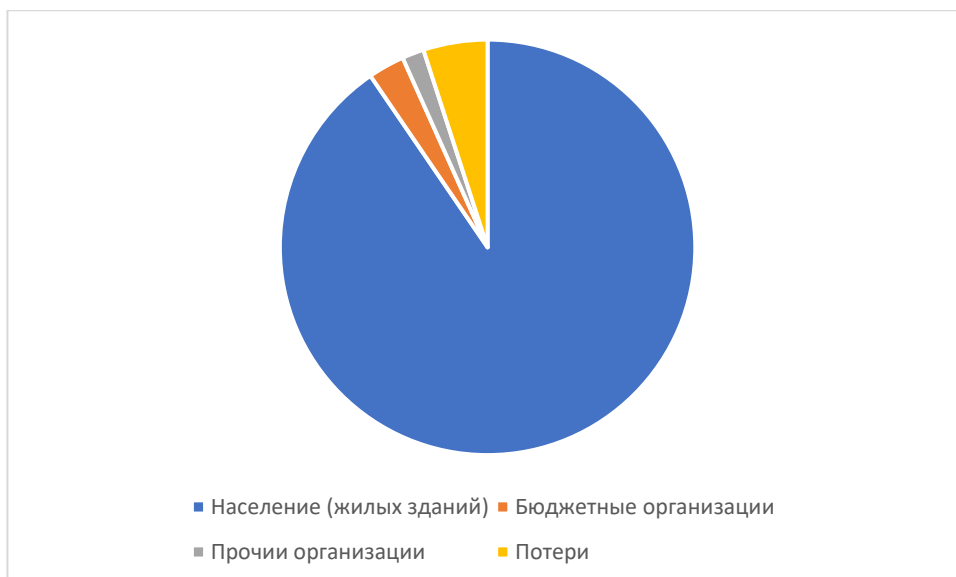
Рисунок 1.3.3 – Структурный баланс полезно отпущенной воды в 2025 году

Наибольший объем потребления питьевой воды на территории Старокурмашевского сельского поселения Актанышского муниципального района Республики Татарстан приходится на население.