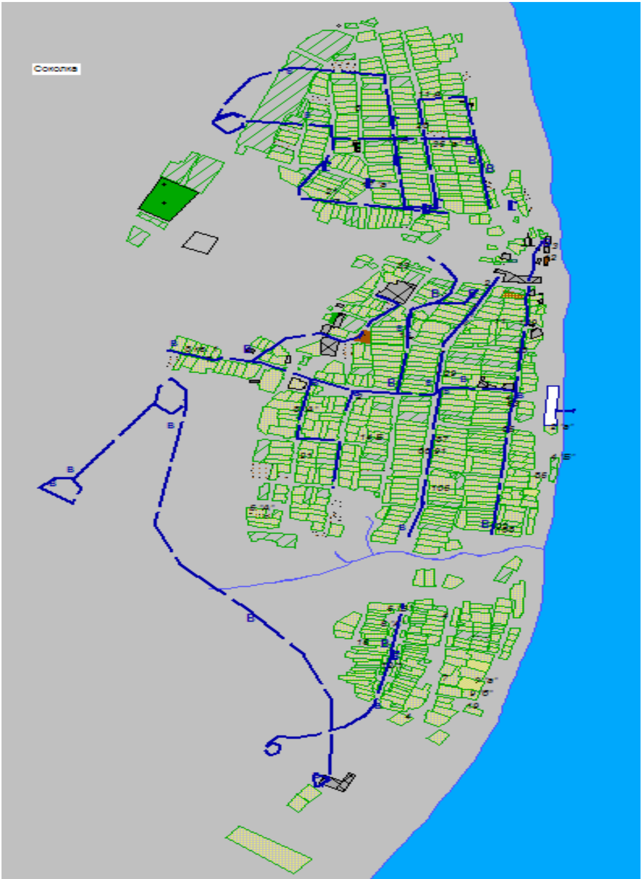
Схема системы водоснабжения н.п. Соколка Сокольского сельского поселения Мамадышского муниципального района РТ