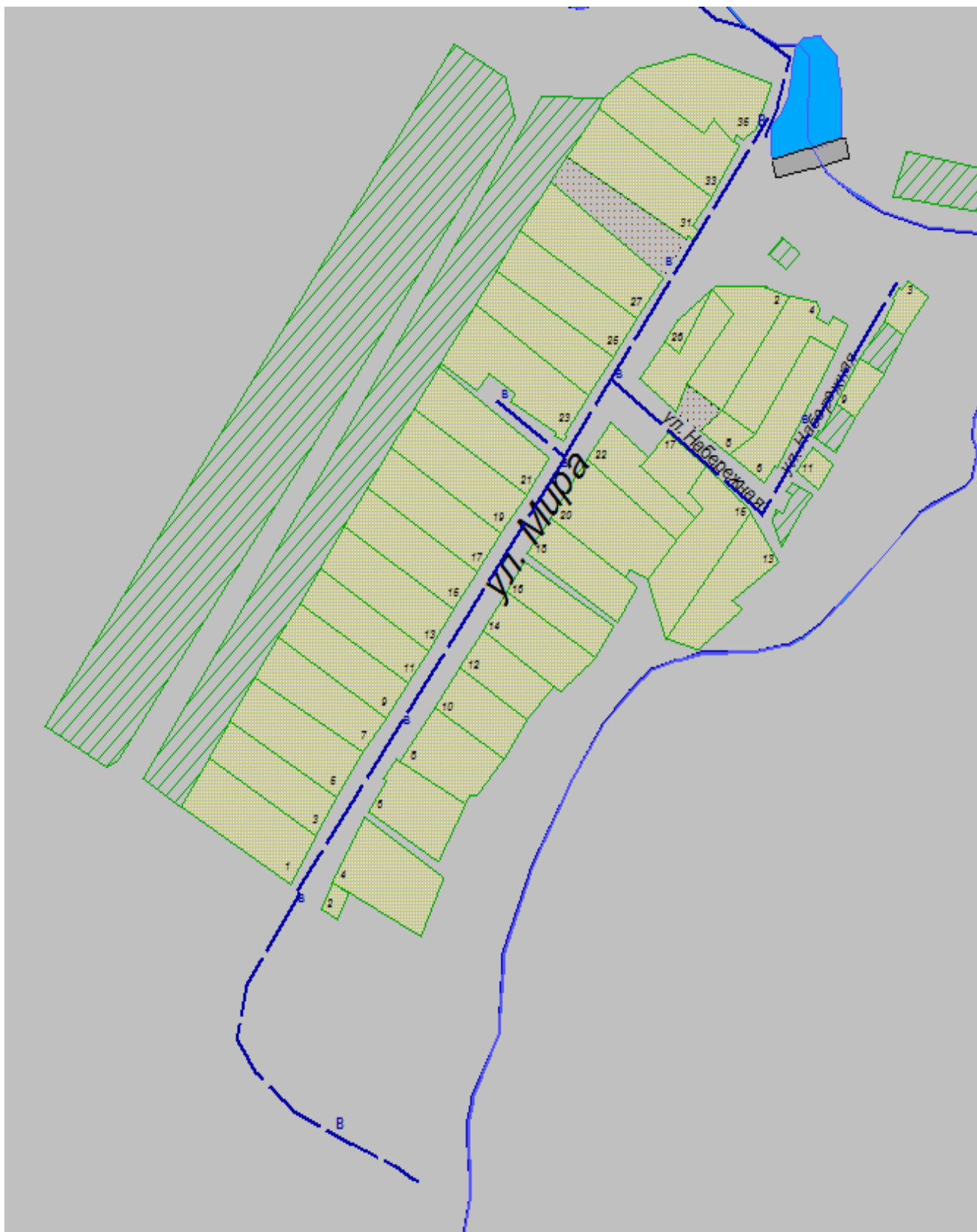
Схема системы водоснабжения н.п. Кряшеный Пакшин Красногорского сельского поселения Мамадышского муниципального района РТ