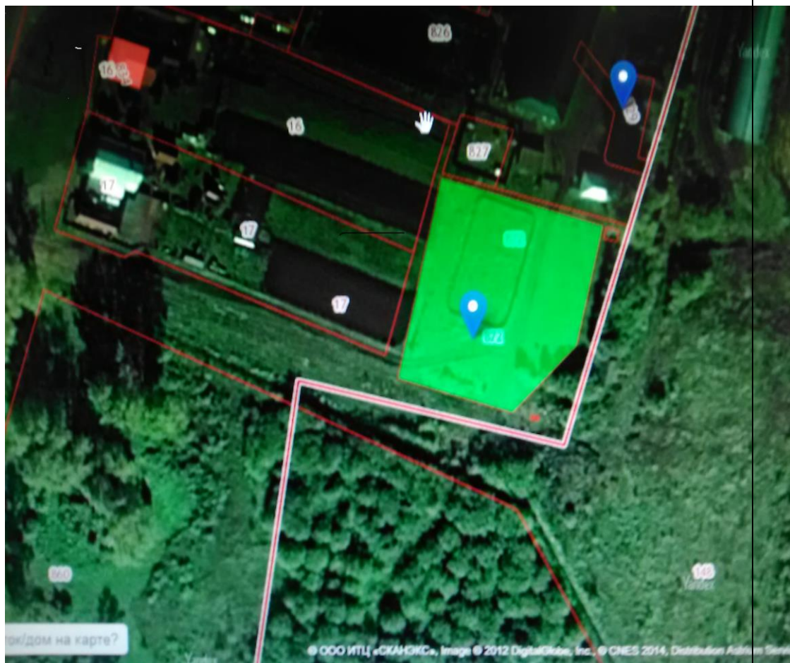
Место (площадка)накопления ТКО

РТ, Буинский район, д. Мещеряково, ул. Мусы Джалиля, д. 107, спортплощадка школы, кадастровый номер 16:14:140201:872 ориентировочная площадь 4 кв.м