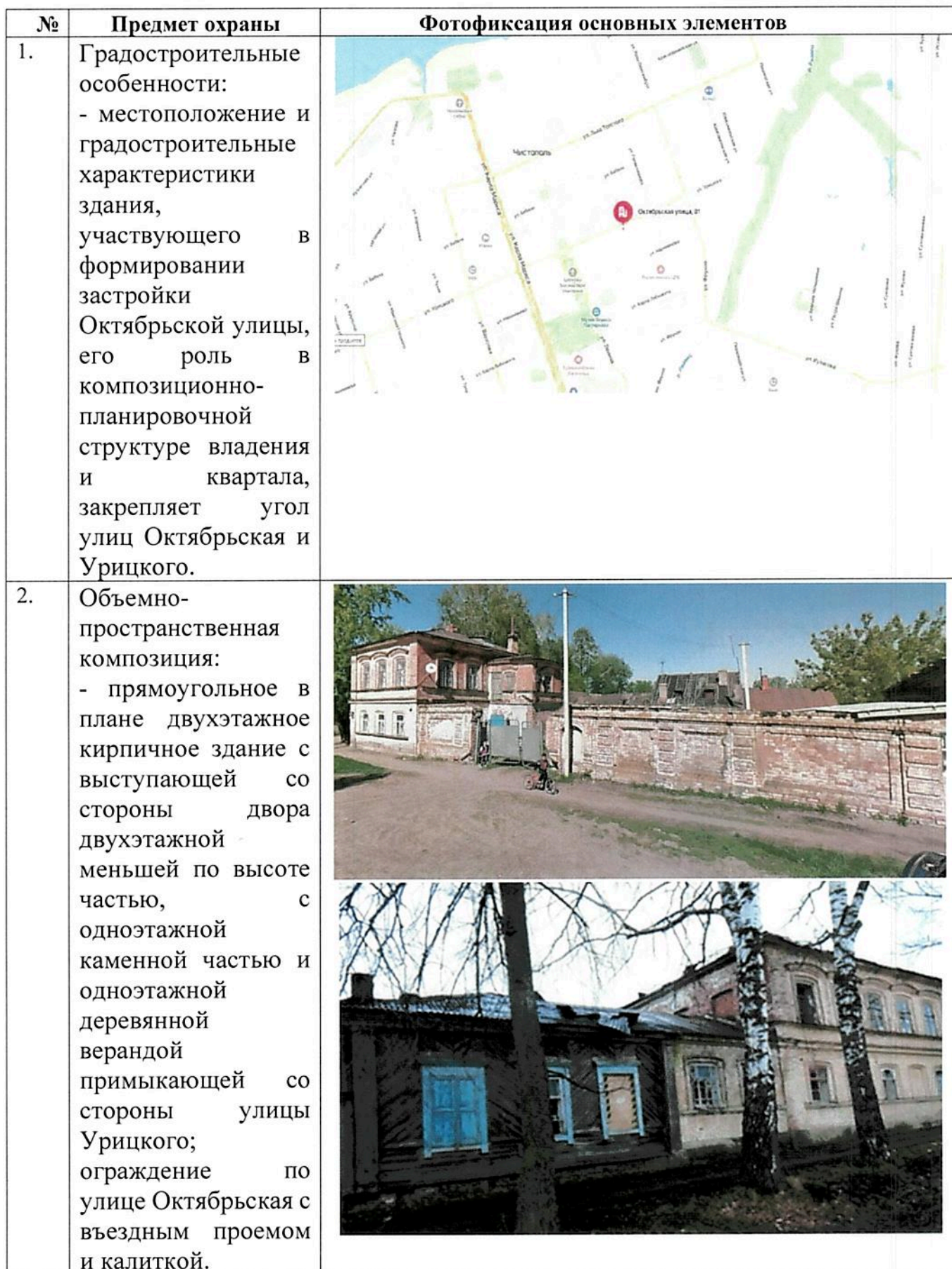
ТАБЛИЦА ПРЕДМЕТА ОХРАНЫ (ОСНОВНЫХ ЭЛЕМЕНТОВ, ПРЕДЛАГАЕМЫХ К ОХРАНЕ*)