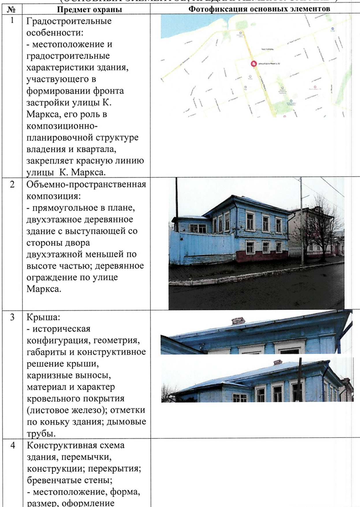
ТАБЛИЦА ПРЕДМЕТА ОХРАНЫ (ОСНОВНЫХ ЭЛЕМЕНТОВ, ПРЕДЛАГАЕМЫХ К ОХРАНЕ*)