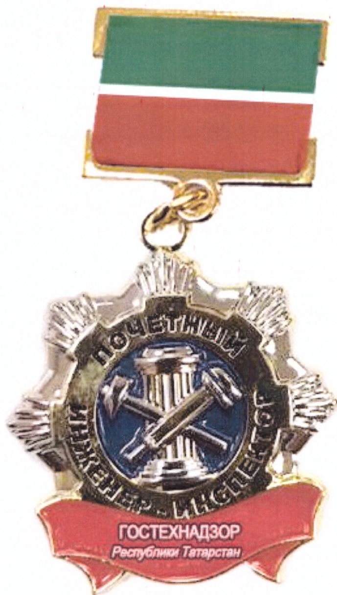
Рисунок нагрудного знака «Почетный инженер-инспектор гостехнадзора Республики Татарстан»