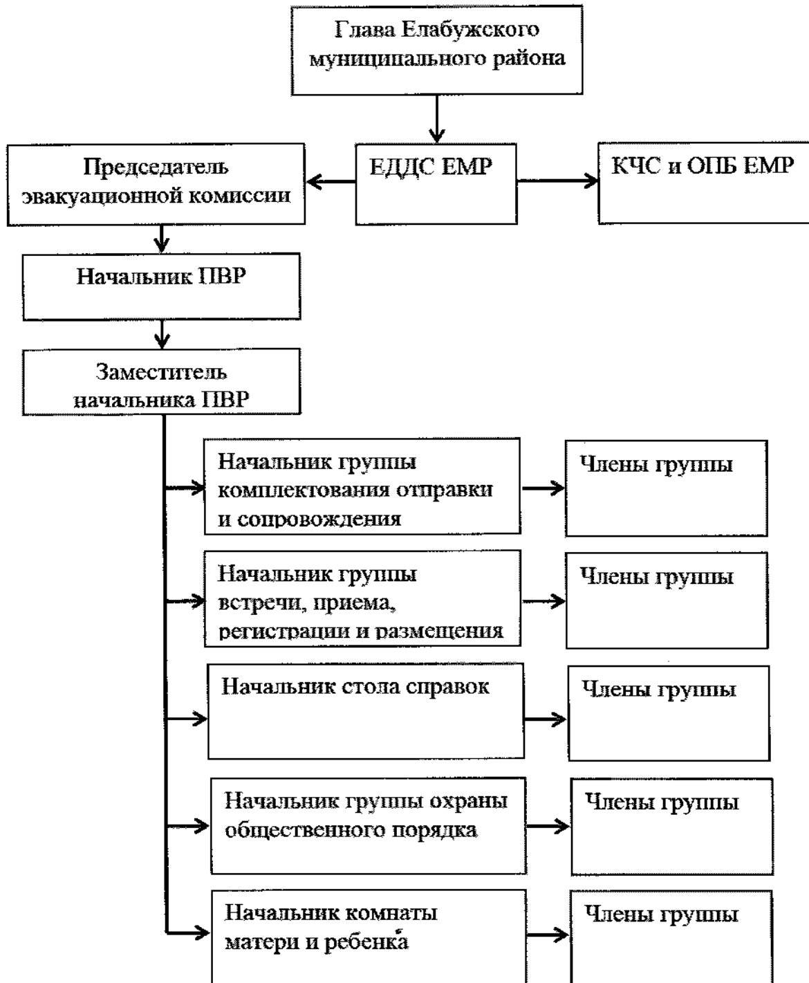
Схема оповещения и сбора администрации пункта временного размещения