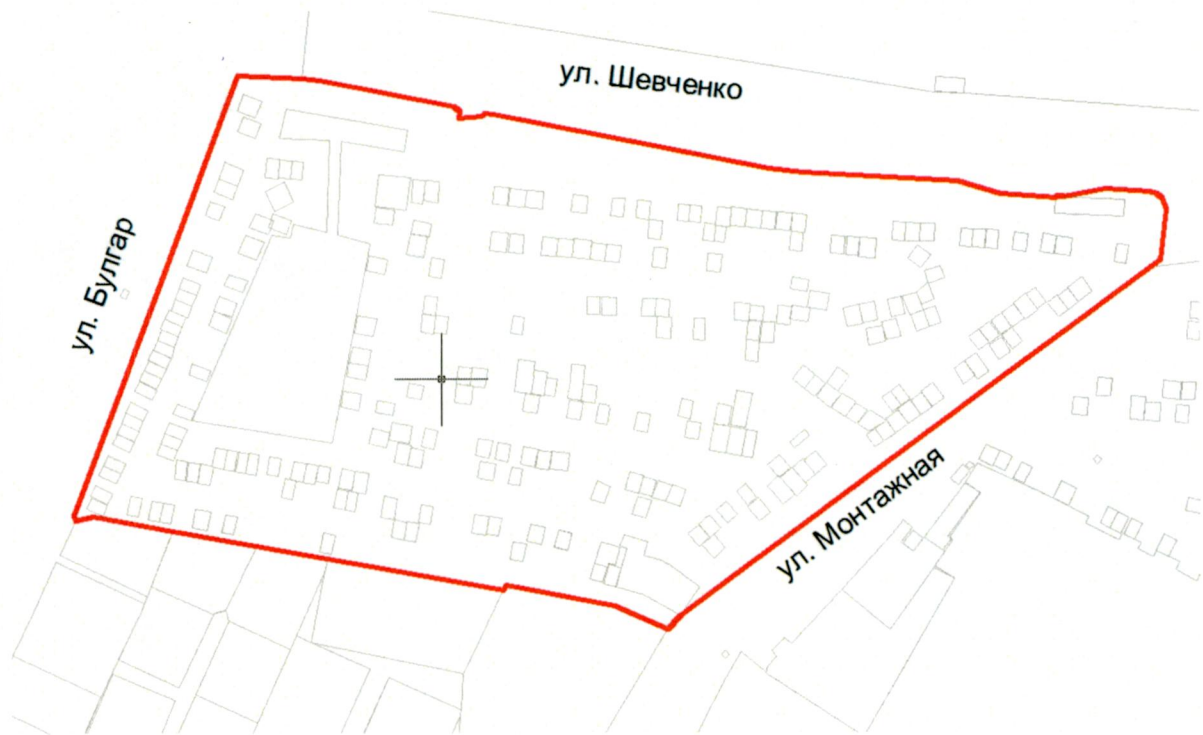
Схема границ территории, в отношении которой принято решение о комплексном освоении территории

Координаты территории, в отношении которой принято решение о комплексном освоении территории