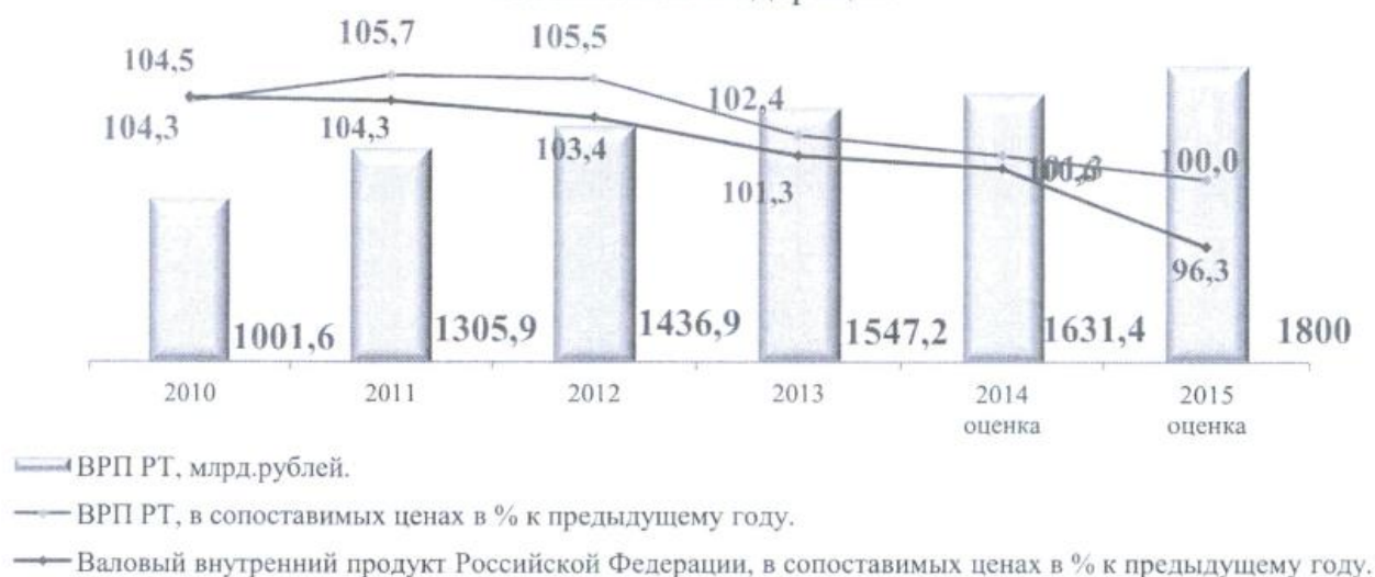
Динамика ВРП Республики Татарстан и валового внутреннего продукта Российской Федерации

Вместе с тем реализация в Татарстане инвестиционных проектов, развитие инструментов поддержки инновационного развития, малого и среднего бизнеса, а также реализация антикризисных мероприятий позволили приблизить валовый региональный продукт республики, по оценке, в сопоставимых ценах к уровню 2014 года – 100 процентов. Объем валового регионального продукта (далее – ВРП) в 2015 году оценивается на уровне 1 800 млрд.рублей.