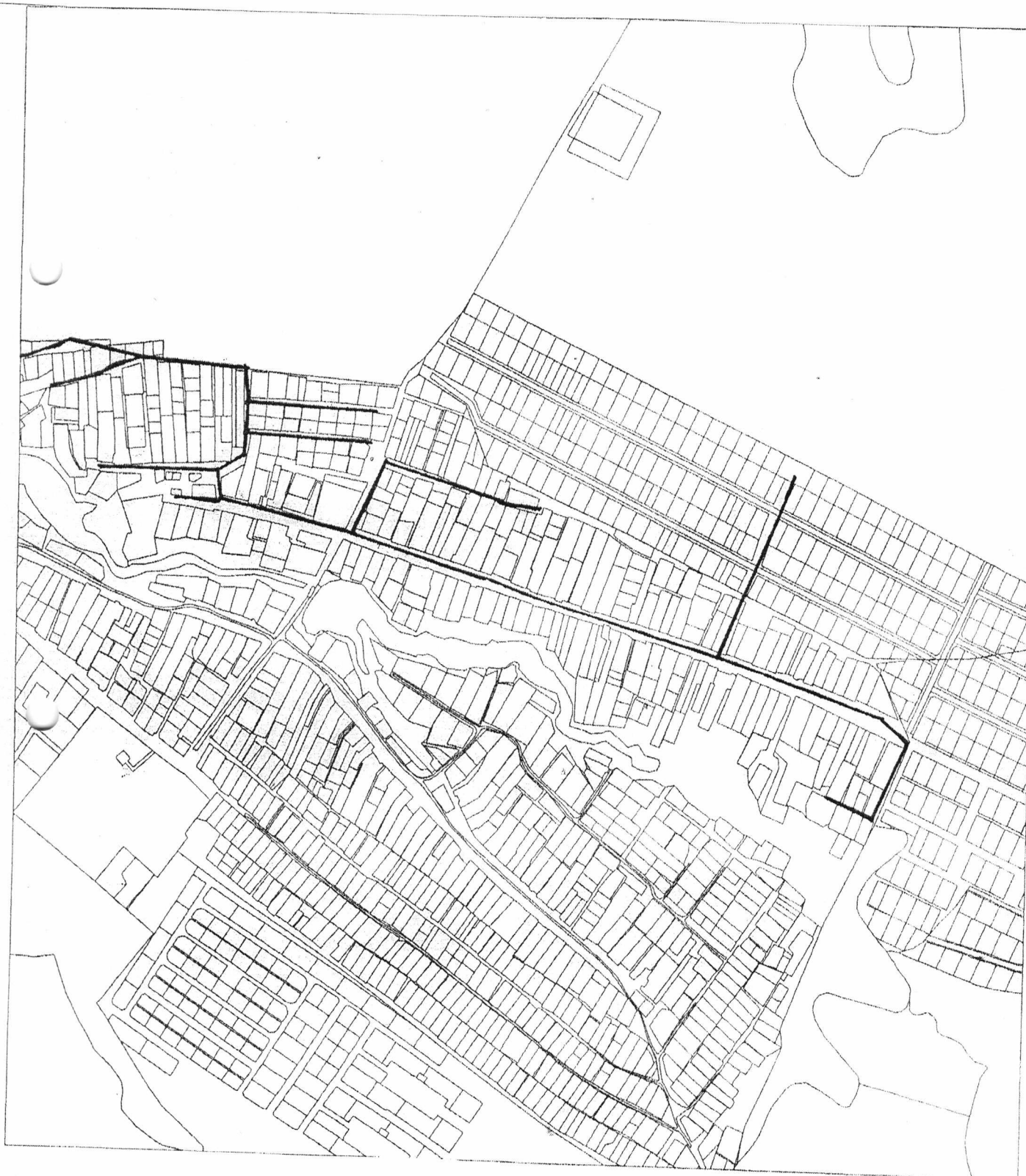
Схема водоснабжения и водоотведения в н.п. Куюки Богородского сельского поселения Пестречинского муниципального района Республики Татарстан

Приложение № 4 к Постановлению Исполнительного комитета Богородского сельского поселения Пестречинского муниципального района Республики Татарстан от «25» декабря 2015г. №30