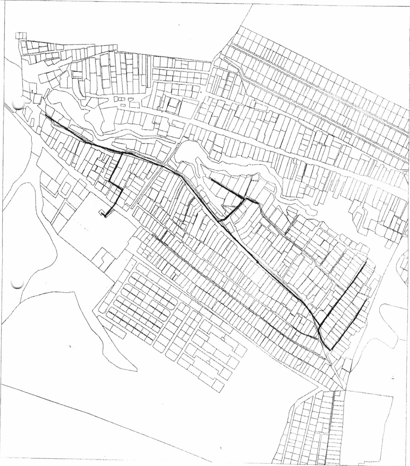
Схема водоснабжения и водоотведения в н.п. Куюки Богородского сельского поселения Пестречинского муниципального района Республики Татарстан

Приложение № 3 к Постановлению Исполнительного комитета Богородского сельского поселения Пестречинского муниципального района Республики Татарстан от «25» декабря 2015г. №30