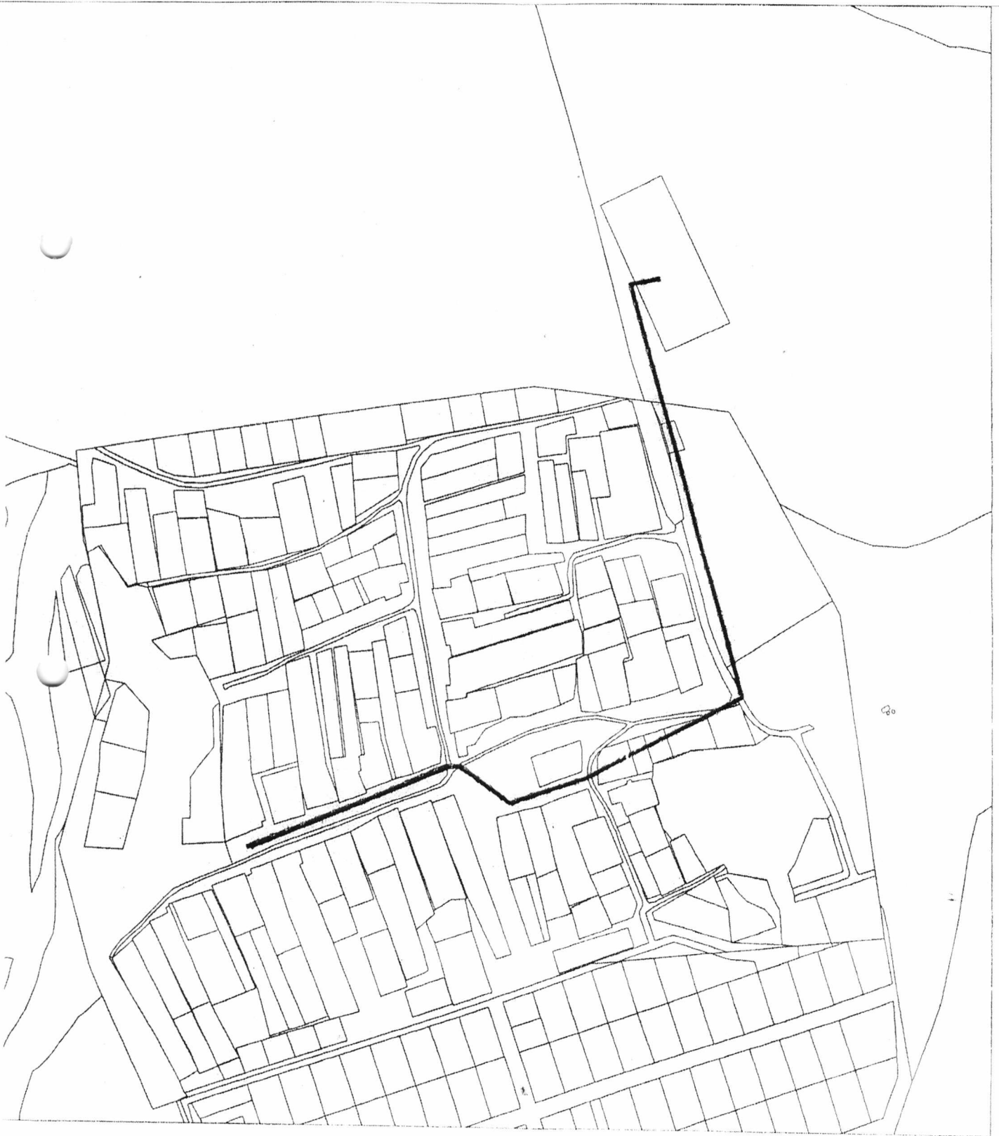
Схема водоснабжения и водоотведения в н.п. Ильинский Богородского сельского поселения Пестречинского муниципального района Республики Татарстан

Приложение № 5 к Постановлению Исполнительного комитета Богородского сельского поселения Пестречинского муниципального района Республики Татарстан от «25» декабря 2015г. №30