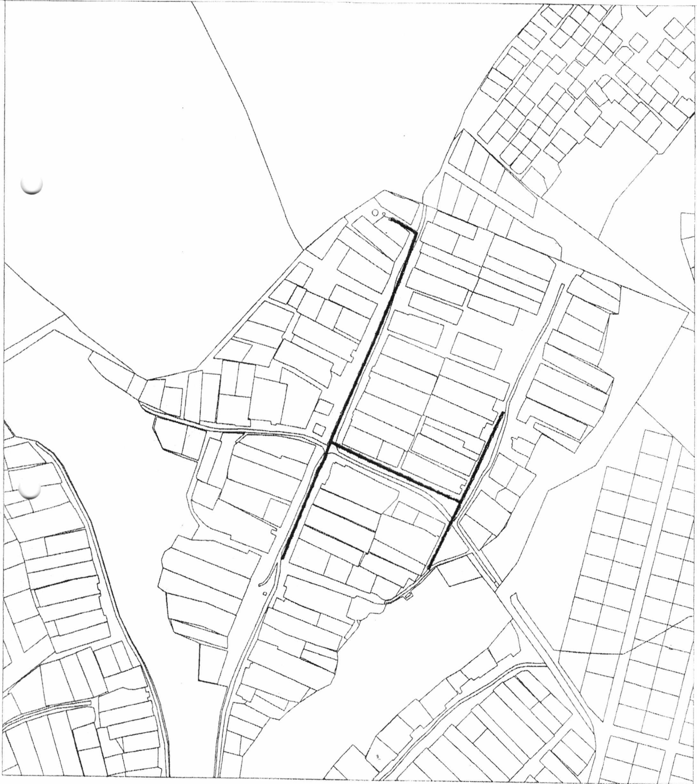
Схема водоснабжения и водоотведения в н.п. Гильдеево Богородского сельского поселения Пестречинского муниципального района Республики Татарстан

Приложение № 1 к Постановлению Исполнительного комитета Богородского сельского поселения Пестречинского муниципального района Республики Татарстан от «25» декабря 2015г. №30