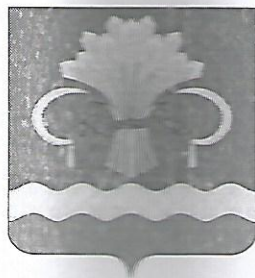
СХЕМА водоснабжения и водоотведения Нижнеошминского сельского поселения Мамадышского муниципального района Республики Татарстан до 2030 года