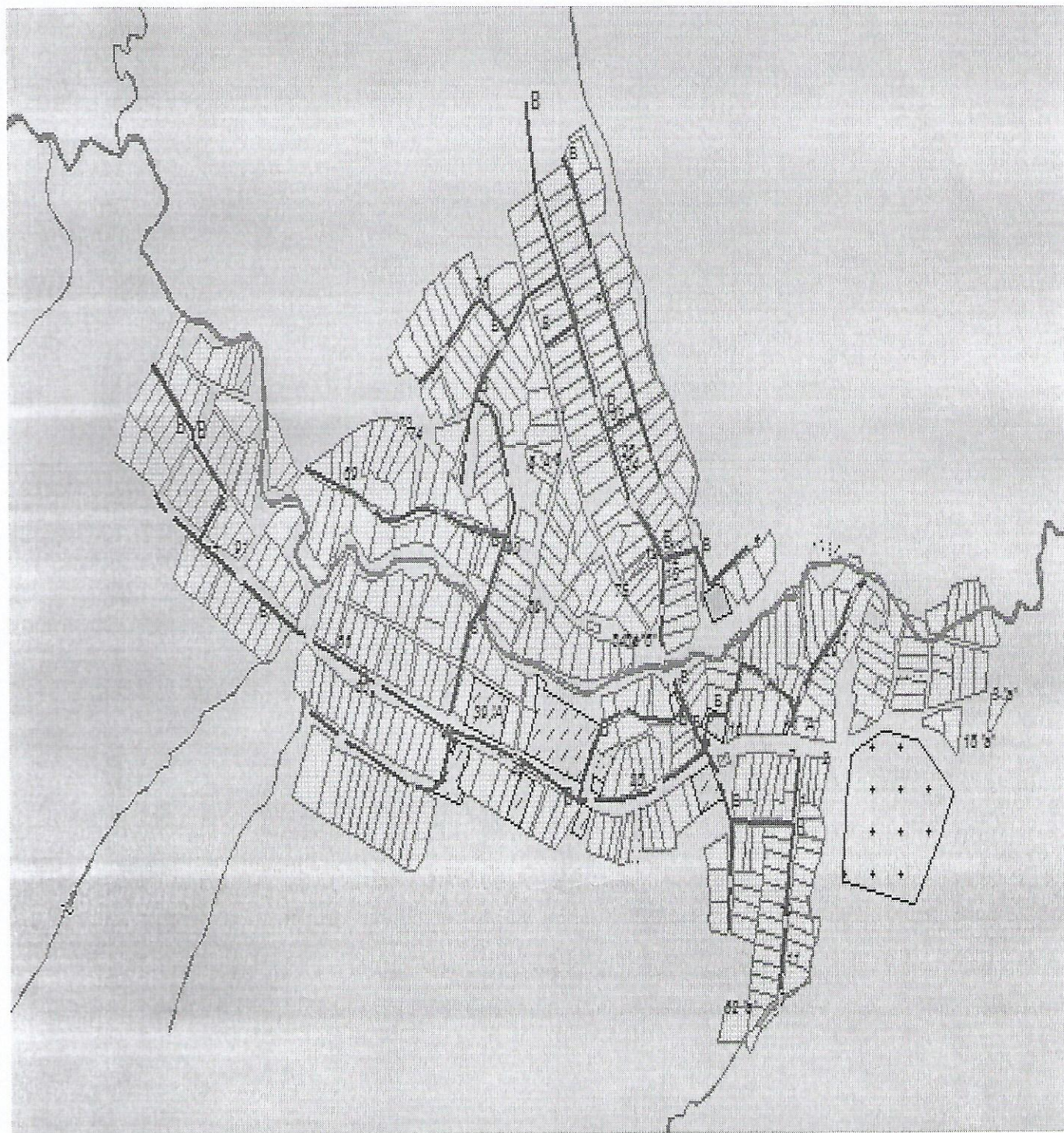
Схема системы водоснабжения н.п. Нижняя Ошма Нижнеошминского сельского поселения поселения Мамадышского муниципального района РТ