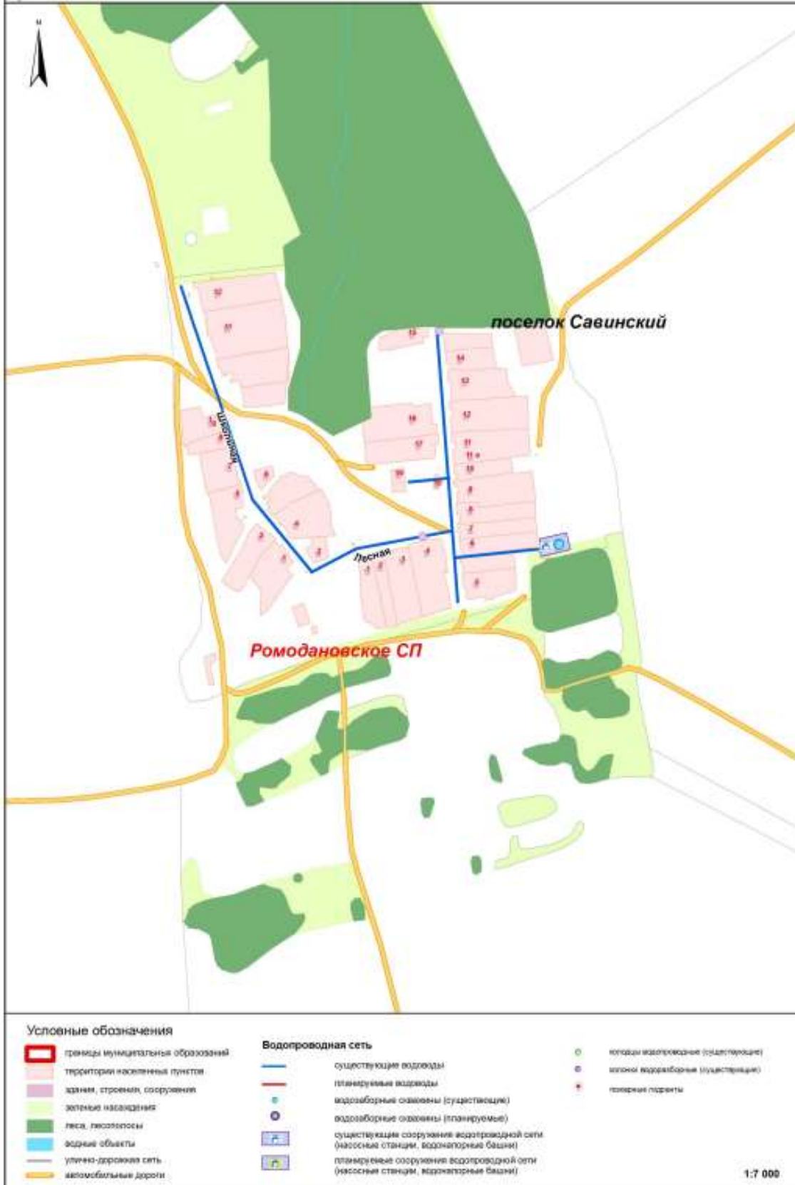
Рисунок 1. Карта (схема) существующего размещения объектов централизованных систем водоснабжения