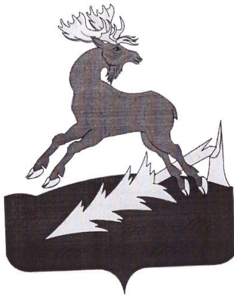
СХЕМА ВОДОСНАБЖЕНИЯ И ВОДООТВЕДЕНИЯ муниципального образования «Левашевское сельское поселение»

Алексеевского муниципального района Республики Татарстан по 2035 год