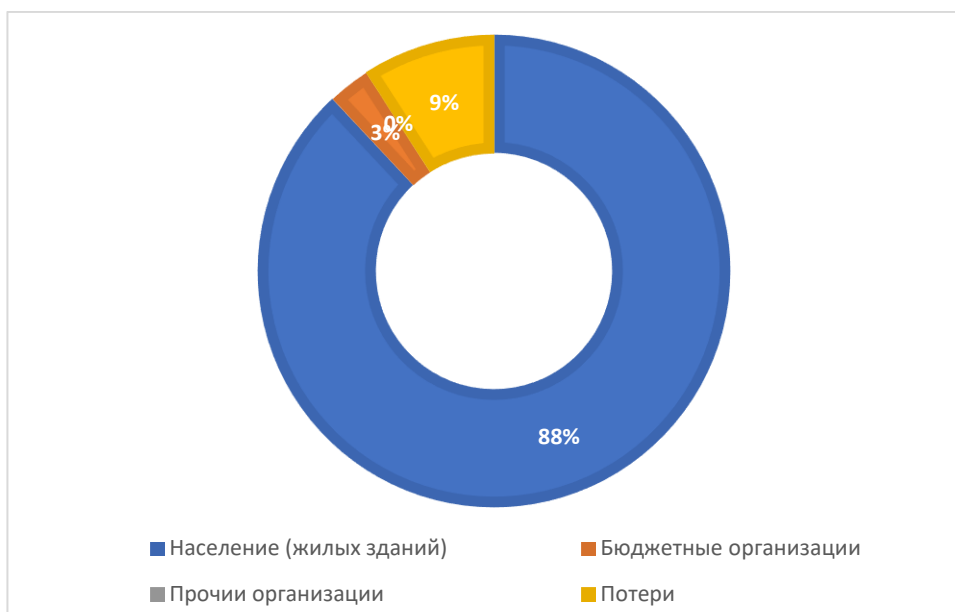
Рисунок 1.3.1 – Баланс поднятой воды по эксплуатационной зоне Поисевского сельского поселения Актанышского муниципального района Республики Татарстан

Данные указаны в соответствии с расчетом потребления по нормативным значениям, учет не ведется.