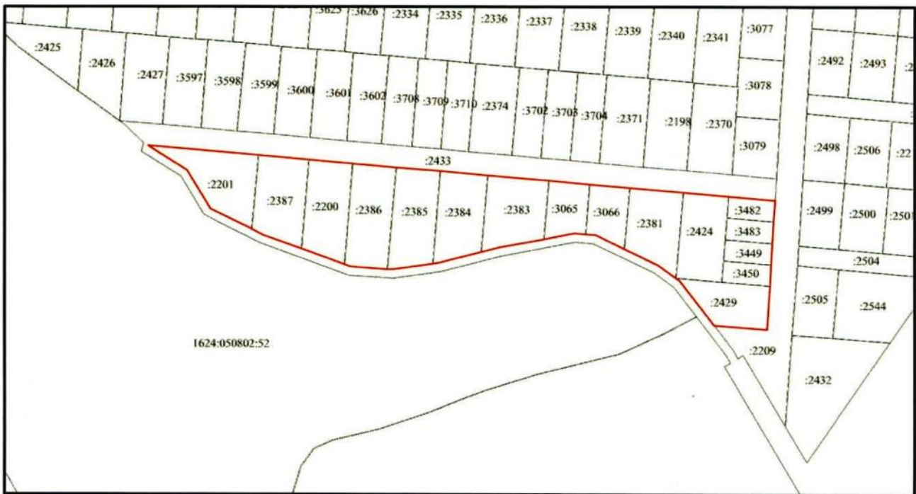
Схема границ подготовки проекта планировки территории