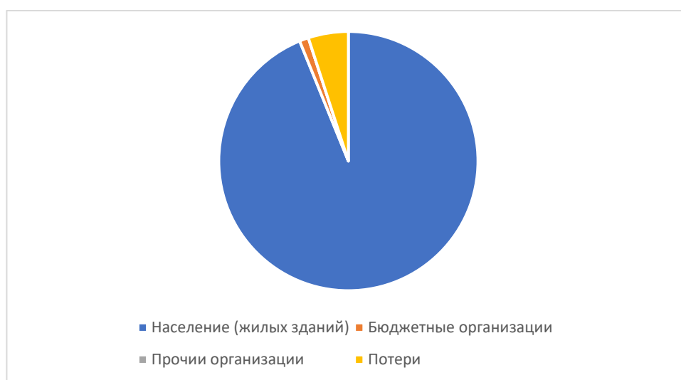
Рисунок 1.3.3 – Структурный баланс полезно отпущенной воды в 2025 году