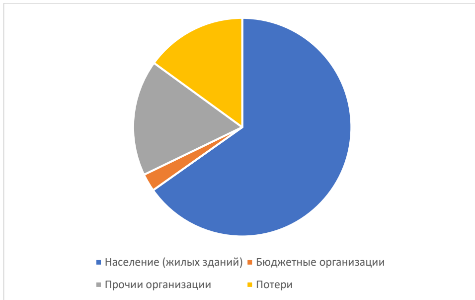
Рисунок 1.3.3 – Структурный баланс полезно отпущенной воды в 2025 году

Наибольший объем потребления питьевой воды на территории Чуракаевского сельского поселения Актанышского муниципального района Республики Татарстан приходится на население.