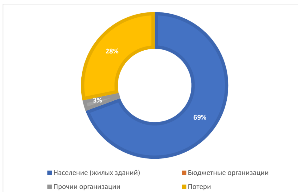
Рисунок 1.3.1.А - Баланс поднятой воды по эксплуатационной зоне Тюковского сельского поселения Актанышского муниципального района Республики Татарстан