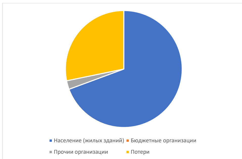
Рисунок 1.3.3 – Структурный баланс полезно отпущенной воды в 2025 году