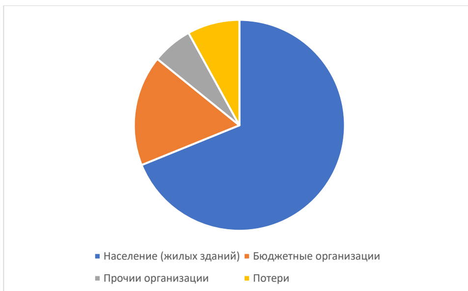
Рисунок 1.3.3 – Структурный баланс полезно отпущенной воды в 2025 году

Наибольший объем потребления питьевой воды на территории Татарско-Суксинского сельского поселения Актанышского муниципального района Республики Татарстан приходится на население.