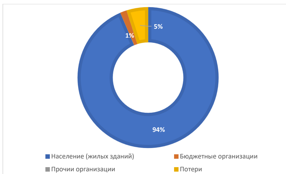
Рисунок 1.3.1 - Баланс поднятой воды по эксплуатационной зоне Татарско-Ямалинского сельского поселения Актанышского муниципального района Республики Татарстан

Данные указаны в соответствии с расчетом потребления по нормативным значениям, учет не ведется.