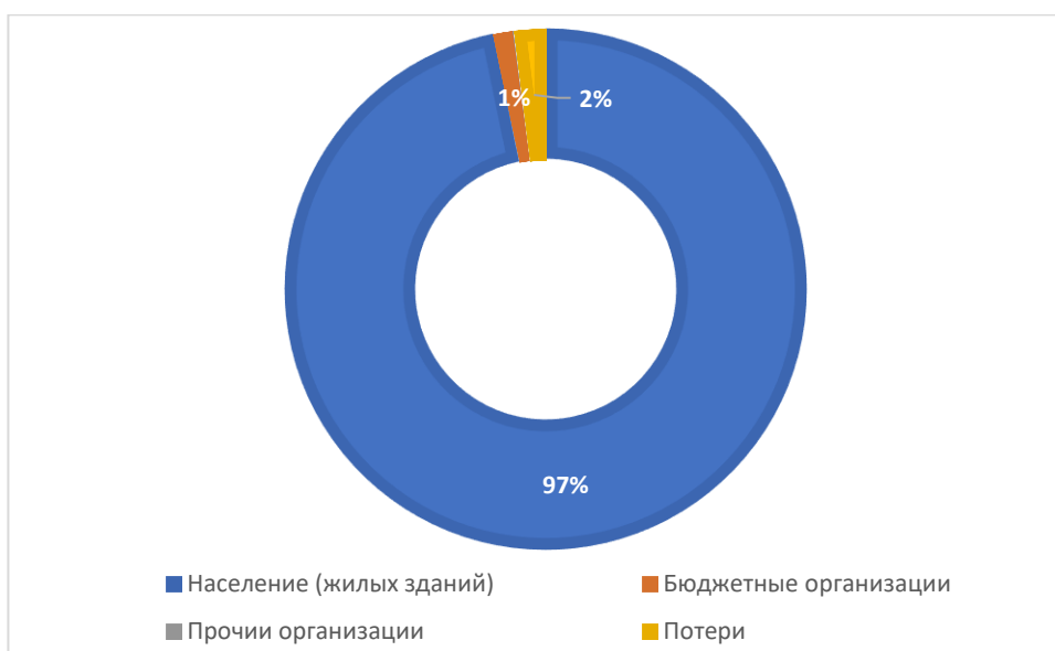
Рисунок 1.3.1 - Баланс поднятой воды по эксплуатационной зоне Старобугадинского сельского поселения Актанышского муниципального района Республики Татарстан

Данные указаны в соответствии с расчетом потребления по нормативным значениям, учет не ведется.