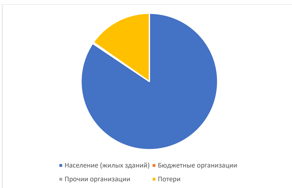
Рисунок 1.3.3 – Структурный баланс полезно отпущенной воды в 2025 году

Наибольший объем потребления питьевой воды на территории Староаймановского сельского поселения Актанышского муниципального района Республики Татарстан приходится на население.