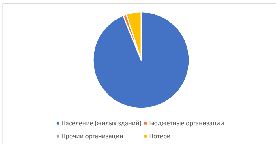
Рисунок 1.3.3 – Структурный баланс полезно отпущенной воды в 2025 году