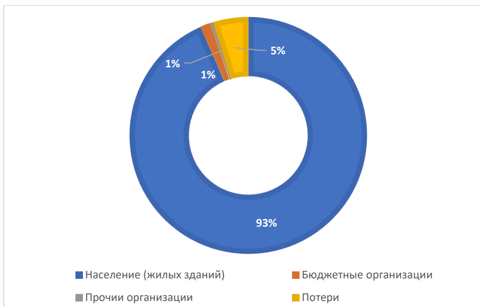
Рисунок 1.3.1 - Баланс поднятой воды по эксплуатационной зоне Аишевского сельского поселения Актанышского муниципального района Республики Татарстан

Данные указаны в соответствии с расчетом потребления по нормативным значениям, учет не ведется.