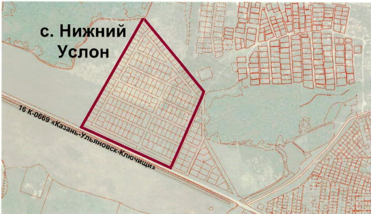
Схема границ подготовки проекта планировки территории