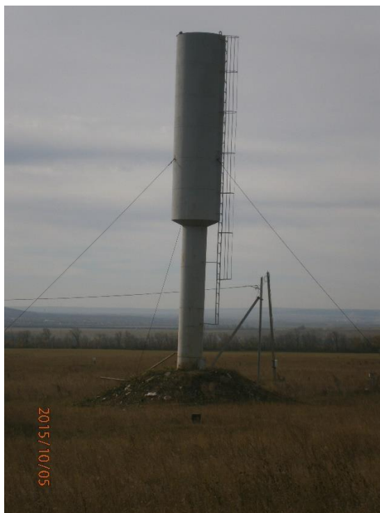
Водонапорная башня н.п.Подгорный

Н. п. Подгорный является сельским поселением Ютазинского района. Здесь имеется централизованная система водоснабжения. Водоснабжение поселения осуществляется на эксплуатации Артезианской скважины. Протяженность водопроводных сетей 3965 км.