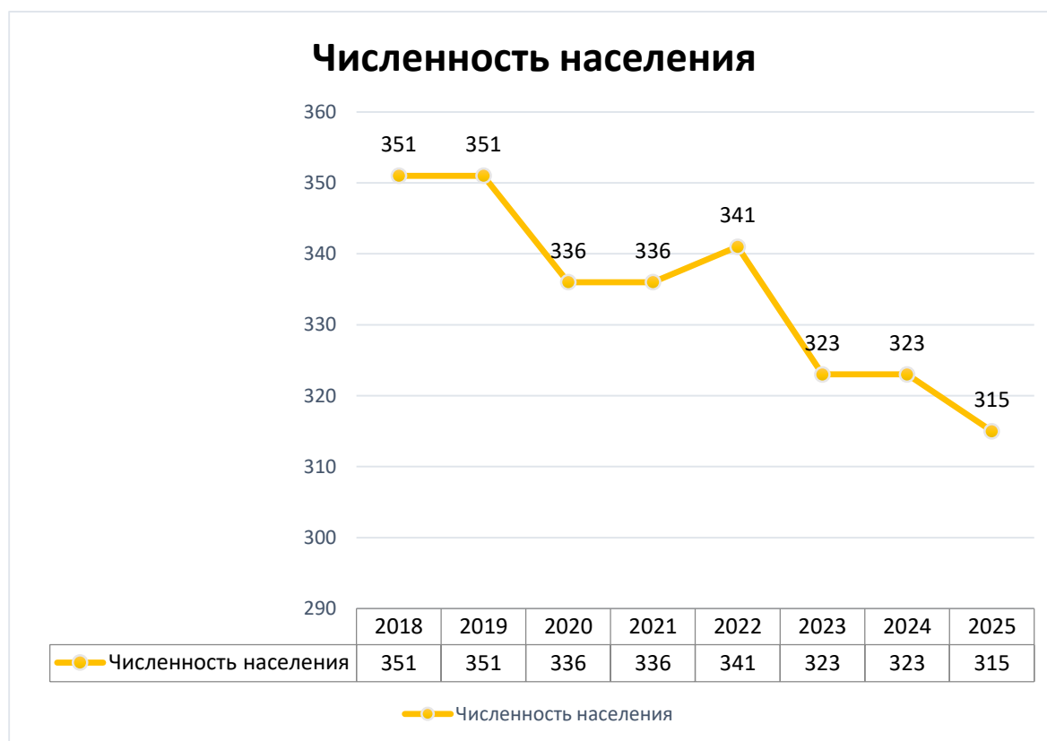
Рисунок 1– Динамика численности населения Альметьевского сельского поселения

Для наиболее полной оценки демографической ситуации важно оценить возрастную структуру численности населения. В таблице 1 показаны данные по возрастной структуре населения Альметьевского сельского поселения за 2025 год.