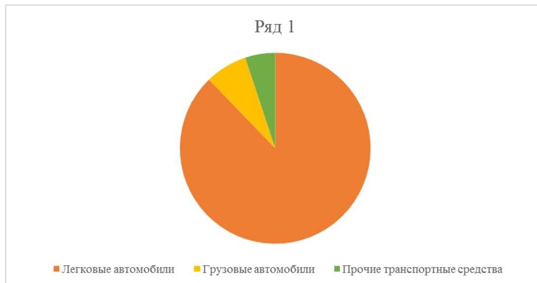
Рисунок 3 – Информация по видам транспорта Альметьевского с.п.

Для проведения количественного и качественного анализа активного парка транспортных средств на территории муниципального образования – Альметьевское сельское поселение были использованы данные отчетов Федеральной налоговой службы Российской Федерации (ФНС РФ). Количество транспорта по Альметьевскому с.п. на 2025 год составлял 125 транспортных средств. Большую часть транспортных средств, зарегистрированных на территории города, составляют легковые автомобили, более подробная информация по видам транспорта представлена на диаграмме (рисунок 3).