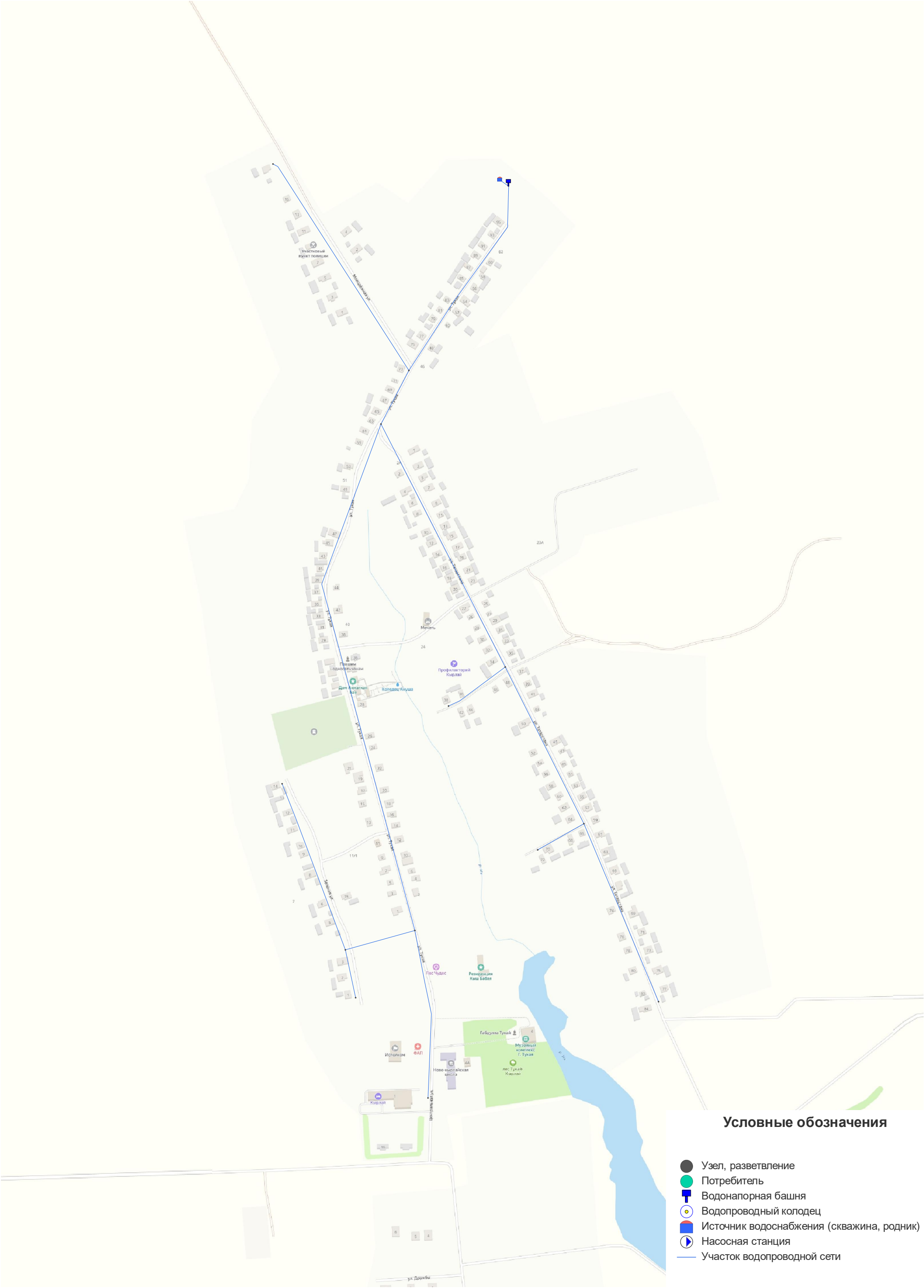
Приложение 1 - Схема сетей водоснабжения с. Новый Кырлай