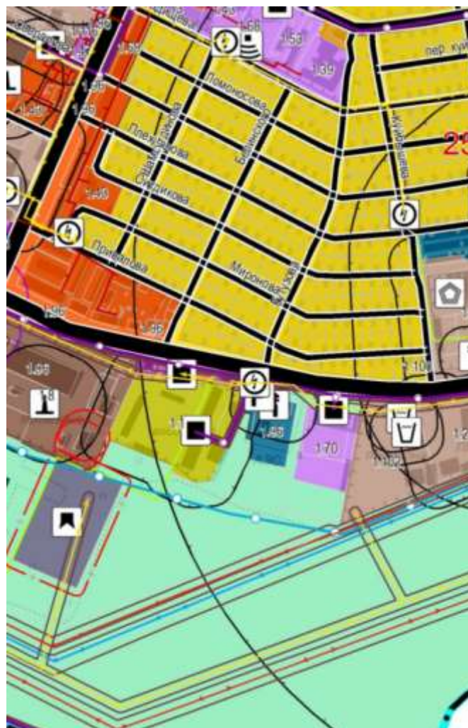
ЗОНУИТ: – Ориентировочная санитарно-защитная зона предприятий, сооружений и иных объектов