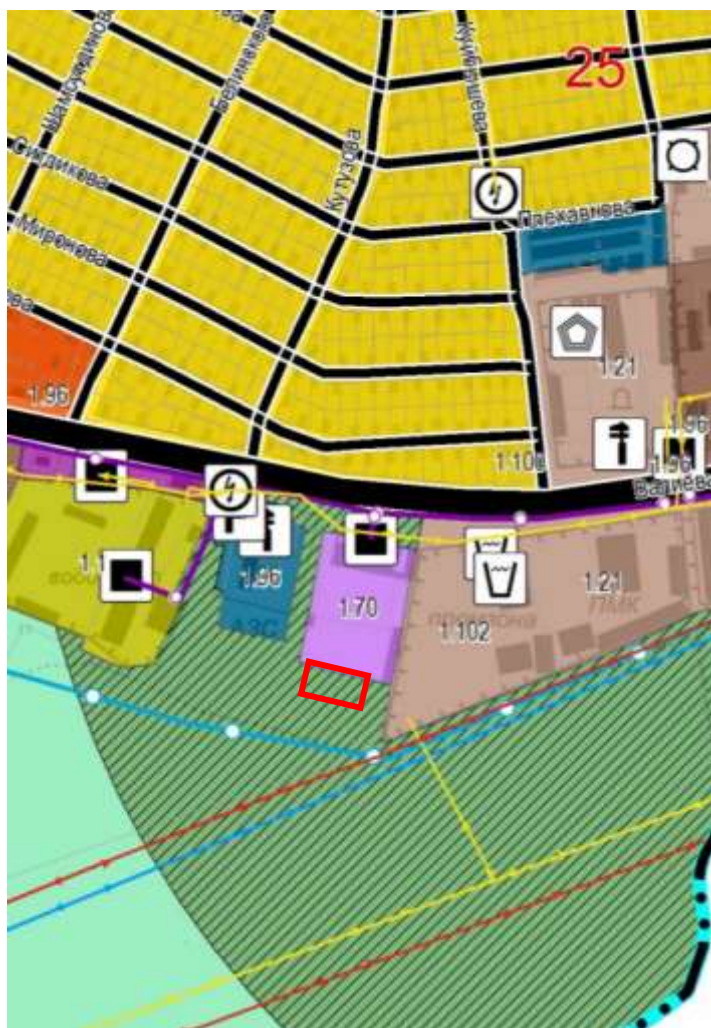
Зона озелененных территорий специального назначения (проекта)