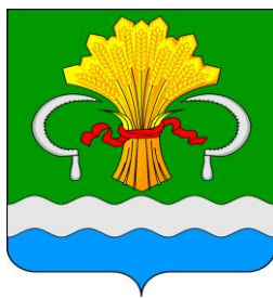
СХЕМА водоснабжения и водоотведения Уразбахтинского сельского поселения Мамадышского муниципального района Республики Татарстан до 2034 года