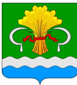
СХЕМА водоснабжения и водоотведения Никифоровского сельского поселения Мамадышского муниципального района Республики Татарстан до 2034 года