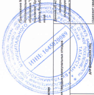
Реестр мест (площадок) накопления твердых коммунальных отходов на территории муниципального образования "Мулыбугулимское сельское поселение" Булугулимского муниципального района Республики Татарстан

Приложение №2 к постановлению Исполнительного комитета муниципального образования "Мулыбугулимское сельское поселение" Булугулимского муниципального района Республики Татарстан №54 от 10