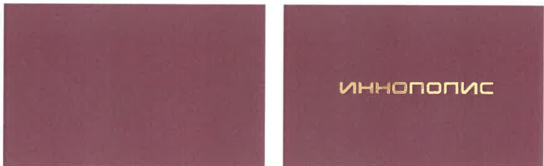
«Образец обложки удостоверения».