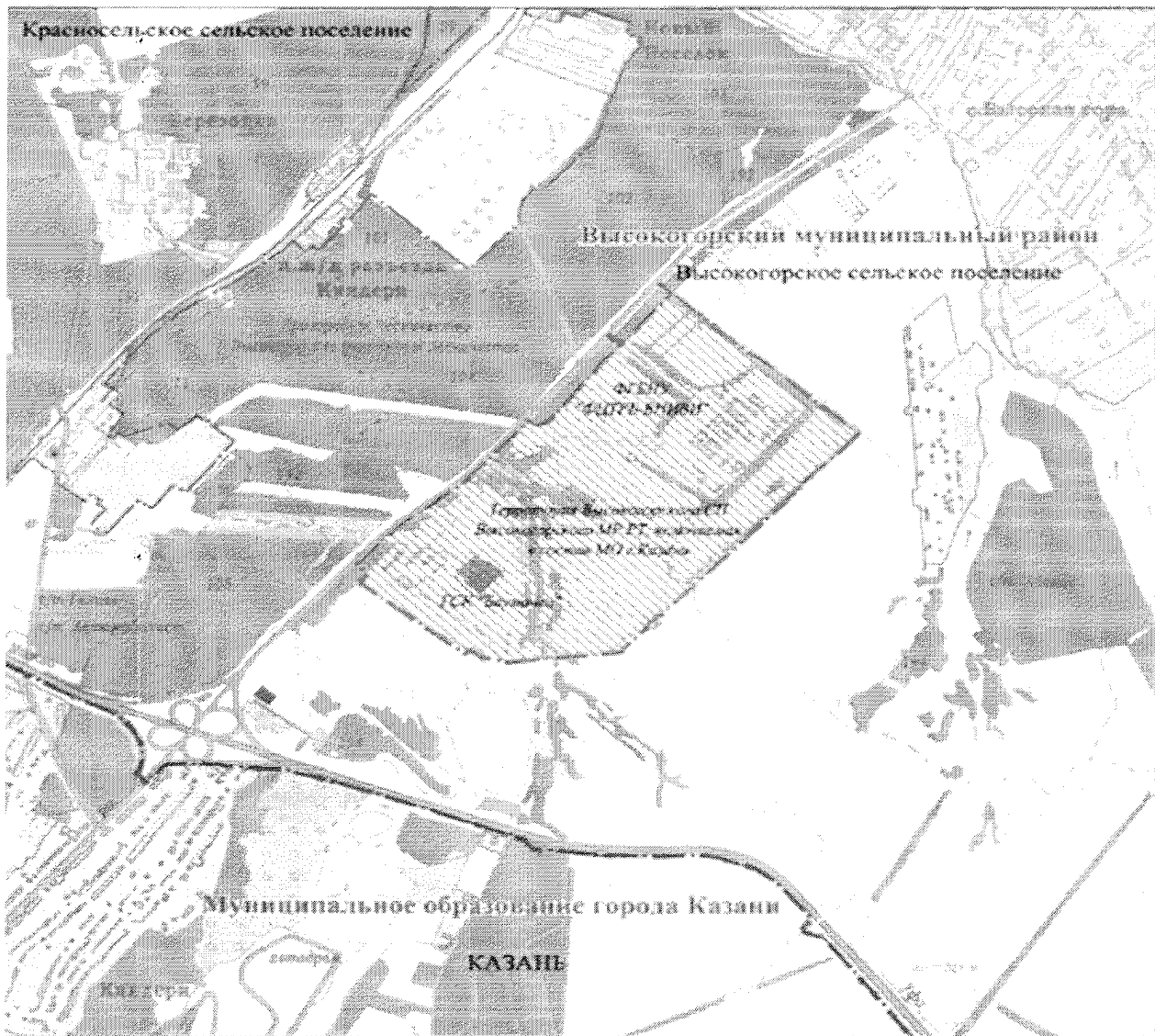
Схема изменения границ муниципального образования города Казани и Высокогорского сельского поселения Высокогорского муниципального района Республики Татарстан